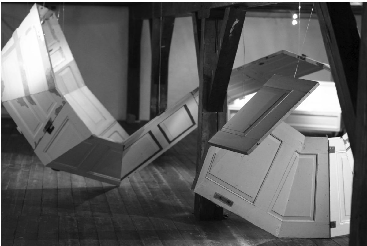
Dørskræl - Present Cycles